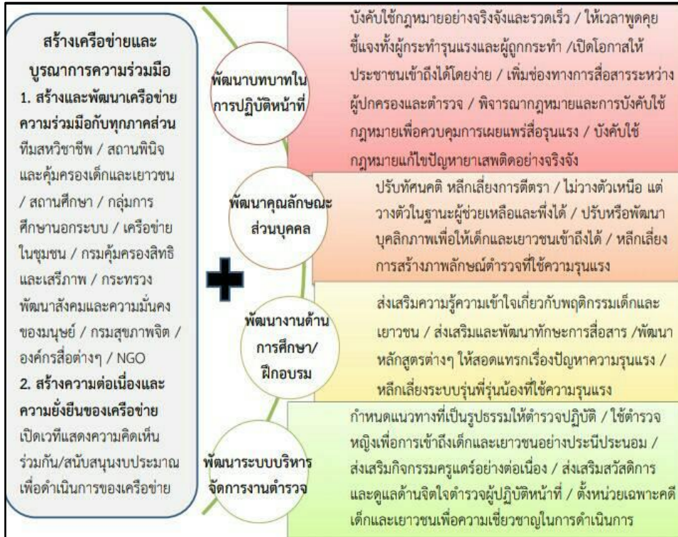
ภาพประกอบ 2 แสดงโมเดลการพัฒนาบทบาทตำรวจและการบูรณาการความร่วมมือเพื่อการป้องกันและแก้ไขปัญหาการใช้ความรุนแรงของเด็กและเยาวชน

จากภาพประกอบ 2 แสดงข้อค้นพบที่ต้องการนำเสนอ แนวทางในการพัฒนาบทบาทตำรวจ ทั้งในด้านการบังคับใช้กฎหมายที่ครอบคลุมทั้งการพัฒนาบทบาทในการปฏิบัติหน้าที่ การพัฒนาคุณลักษณะส่วนบุคคล การพัฒนาด้านการศึกษาและฝึกอบรม และการพัฒนาระบบการบริหารงานตำรวจ และแสดงถึง แนวทางการสร้างเครือข่ายและบูรณาการความร่วมมือ ที่ปรากฏเครือข่ายความร่วมมือที่เพิ่มเติมจากเครือข่ายความร่วมมือเดิมที่มีอยู่ในปัจจุบัน ทั้งสองแนวทางนี้ต้องพัฒนาควบคู่กันไป เพื่อให้เกิดประสิทธิภาพทั้งในเชิงป้องกันและแก้ไขปัญหา ซึ่งในส่วนของการพัฒนาบทบาทตำรวจนั้น พบว่า ข้อค้นพบที่เป็นแนวทางในการพัฒนาบทบาทตำรวจครอบคลุมทั้งการบังคับใช้กฎหมาย (Law Enforcement) การรักษาความสงบเรียบร้อย (Order Maintenance) และการให้บริการ (Service-Related Duties) โดยเฉพาะในส่วนการบังคับใช้กฎหมายที่เน้นให้เกิดประสิทธิผล 4 ประการ ได้แก่ (1) ความแน่นอนในการบังคับใช้กฎหมาย คือ ต้องทำให้ผู้กระทำความผิดมีโอกาสที่จะถูกจับกุมและถูกพิจารณาคดีตามบทบัญญัติของกฎหมาย (2) ความรวดเร็วในการบังคับใช้กฎหมาย ทั้งขั้นตอนการจับกุม