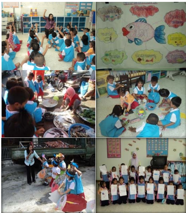
ภาพประกอบ 1 การใช้รูปแบบการจัดประสบการณ์เรียนรู้ SANTSUK หัวข้อ ปลา