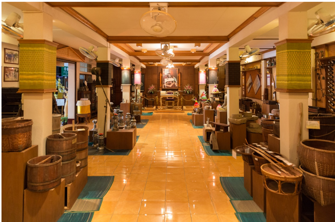
ภาพประกอบ 15 – 16 ศูนย์วัฒนธรรมเฉลิมราชวัดฝั่งคลอง อ.ปากพลี จ.นครนายก ศูนย์กลางการจัดแสดงนิทรรศการวัฒนธรรมไทยพวน