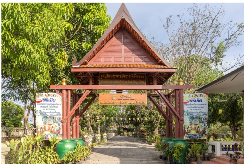
ภาพประกอบ 1 ศูนย์วัฒนธรรมเฉลิมราชวัดฝั่งคลอง อ.ปากพลี จ.นครนายก พื้นที่ศูนย์กลางการจัดแสดงทางวัฒนธรรมไทยพวน

คองที่ 14 อย่าเสพงามคุณในวันศีล วันเข้าพรรษา วันออกพรรษา วันมหาสงกรานต์ และวันเกิดของตน