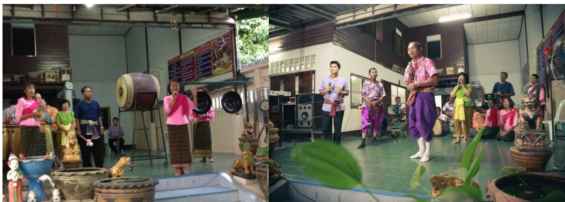
ภาพประกอบ 10 – 11 การแสดงรำพวนของชาวชุมชนเกาะหวาย เพื่อต้อนรับผู้มาเยือนชุมชน