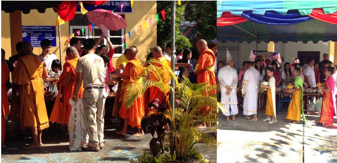
ภาพประกอบ 5 – 6 ตักบาตรเทโวโรหณะ ณ วัดท่าแดง อ.ปากพลี จ.นครนายก

มาจากจังหวัดเดียวกัน ก็มาจากเมืองเชียงขวาง สปป.ลาว กันหมดอะแหละ บางคนก็มา 100 กว่าปี บางคนก็มา 200 กว่าปีแล้วที่มา” (ลุงพล)