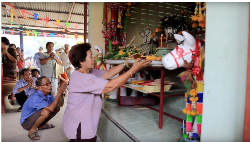
ภาพประกอบ 7 ทำบุญขวบปีศาจปู้ตา ณ ชุมชนบ้านเกาะหวาย อ.ปากพลี จ.นครนายก