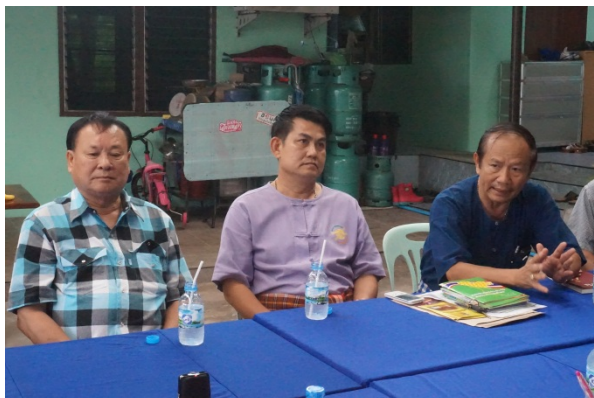
ภาพประกอบ 3 – 4 ผู้นำทางวัฒนธรรมไทยพวนที่มาจากหลากหลายชุมชน ในตำบลเกาะหวาย อำเภอปากพลี จังหวัดนครนายก