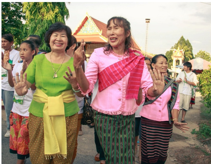
ภาพประกอบ 2 ตัวอย่างการแต่งกายด้วยชุดไทยพวน