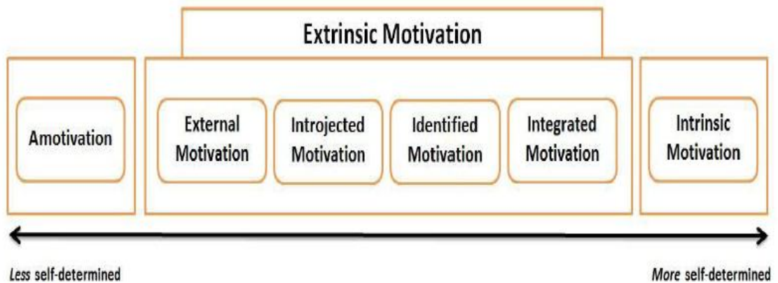
Figure 1: Continuum of extrinsic and intrinsic motivation

Intrinsic Motivation เป็นระดับที่บุคคลกระทำพฤติกรรมนั้นเพราะอยากทำ ทำแล้วสนุก ทำแล้วมีความสุข ทำแล้วท้าทายความสามารถ เป็นต้น