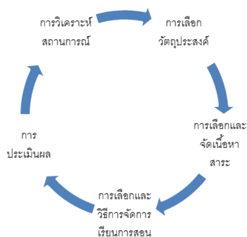
ภาพประกอบ 1 กระบวนการพัฒนาหลักสูตร