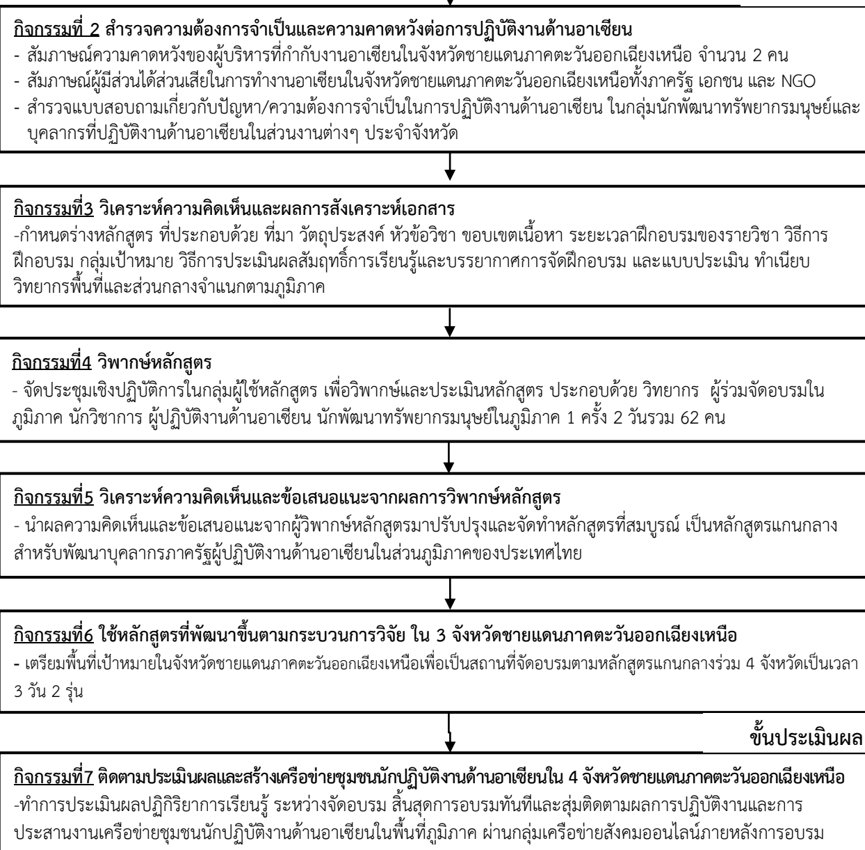
ภาพประกอบ 2 ขั้นตอนในการวิจัยและพัฒนาหลักสูตร