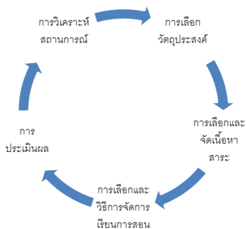
ภาพประกอบ 1 กระบวนการพัฒนาหลักสูตร