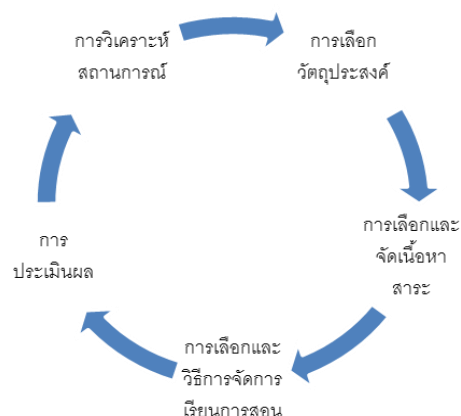
ภาพประกอบ 1 กระบวนการพัฒนาหลักสูตร