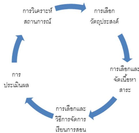
ภาพประกอบ 1 กระบวนการพัฒนาหลักสูตร