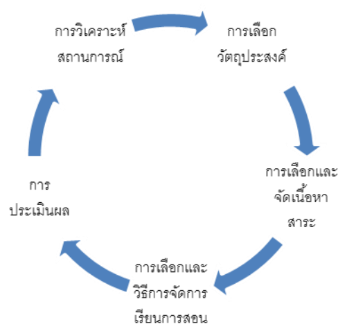
ภาพประกอบ 1 กระบวนการพัฒนาหลักสูตร