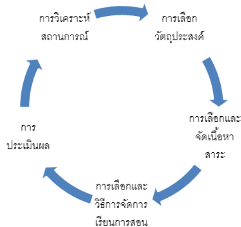
ภาพประกอบ 1 กระบวนการพัฒนาหลักสูตร