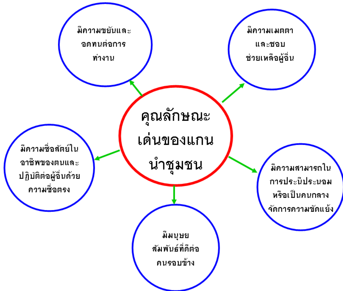
ภาพประกอบ 1 คุณลักษณะเด่นของแกนนำชุมชน