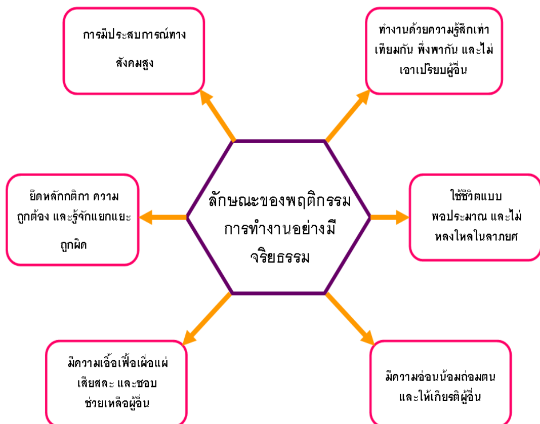
ภาพประกอบ 2 ลักษณะของพฤติกรรมการทำงานอย่างมีจริยธรรม

จากลักษณะของพฤติกรรมการทำงานอย่างมีจริยธรรมของแกนนำชุมชนดังกล่าวมาทั้ง 6 ประการ สามารถแสดงเป็นแผนภาพได้ดังนี้