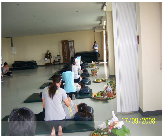
ภาพประกอบ 18 การฝึกนวดประคบหลังคลอด วิชามดุงครรภ์แผนไทย