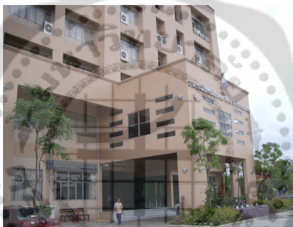
ภาพประกอบ 5 บริเวณด้านหน้าอาคารเรียน