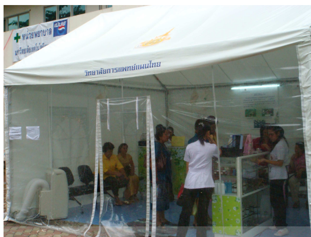
ภาพประกอบ 21 การจัดบูธนอกสถานที่ของนักศึกษา ณ มหาวิทยาลัยเทคโนโลยีราชมงคล คลองหก