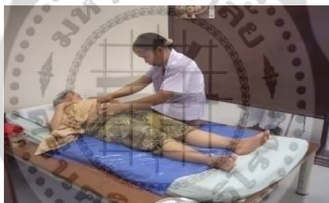
ภาพประกอบ 19 การฝึกนวดประคบหลังคลอดกับผู้ป่วยจริง