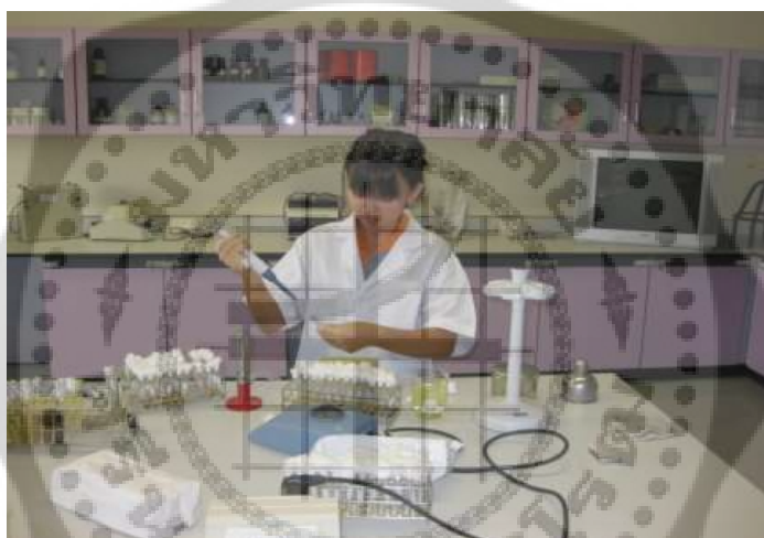
ภาพประกอบ 11 การฝึกทดสอบทางชีวภาพของสมุนไพร