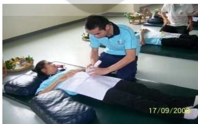
ภาพประกอบ 20 การฝึกดูแลหลังคลอดโดยการทาบหม้อเกลือเพื่อช่วยให้มดลูกเข้าอู่ได้ดี