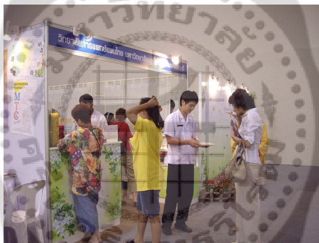
ภาพประกอบ 22 การจัดบูธนอกสถานที่ของนักศึกษา ณ เมืองทองธานี