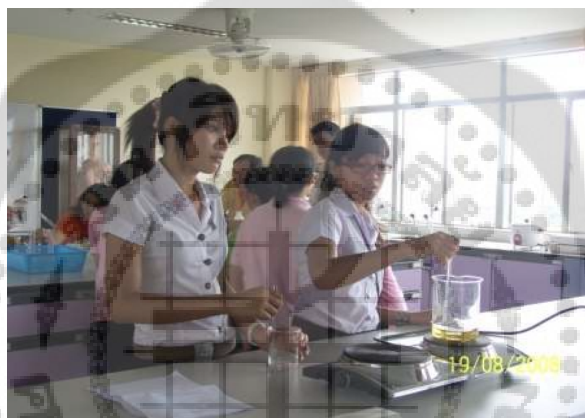
ภาพประกอบ 8 การฝึกปฏองยาสมุนไพรวินิจฉัยพืชพิษศาสตร์