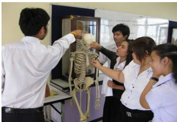
ภาพประกอบ 7 บรรยายภาคการเรียนการสอนวิชากายวิภาคศาสตร์