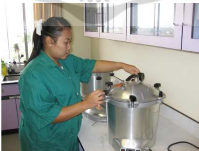
ภาพประกอบ 12 การฝึกเตรียมอุปกรณ์ปลอดเชื้อสำหรับการทดสอบทางชีวภาพ