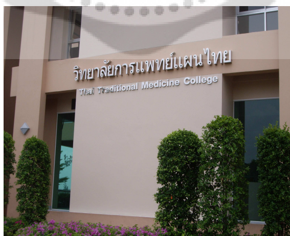
ภาพประกอบ 6 บริเวณด้านข้างอาคารเรียน