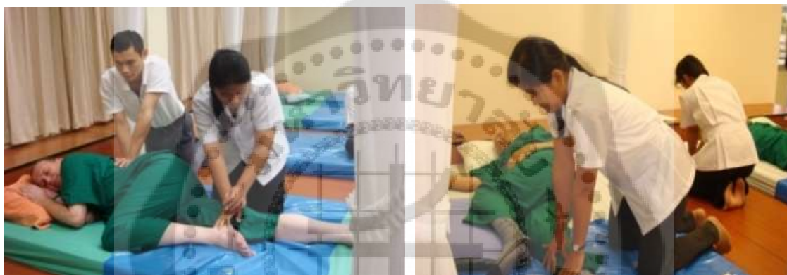
ภาพประกอบ 14 การฝึกนวดรักษาสายราชสำนักสำหรับผู้ป่วยที่มีอาการปวดกล้ามเนื้อหลัง