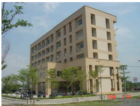
ภาพประกอบ 4 อาคารเรียน