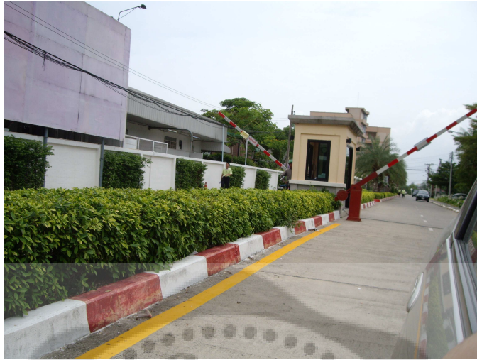
ภาพประกอบ 2 บริเวณทางเข้าวิทยาลัยการแพทย์แผนไทย