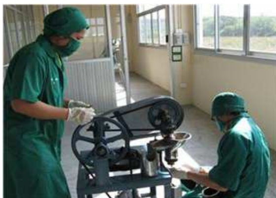
ภาพประกอบ 13 การฝึกใช้เครื่องรีดเส้นยาสำหรับกระบวนการผลิตยาลูกกลอน (ยาเม็ด)