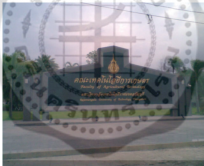
ภาพประกอบ 3 ป้ายทางเข้าวิทยาลัยการแพทย์แผนไทย