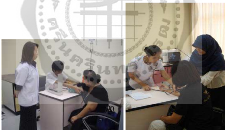
ภาพประกอบ 17 การฝึกวัดความดันโลหิตสำหรับการตรวจร่างกายเบื้องต้น