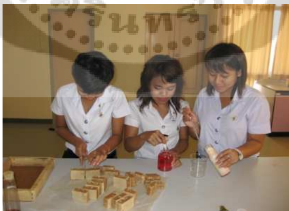
ภาพประกอบ 9 การฝึกปฏิบัติทางเคมี วินิจฉัยเคมีเครื่องสำอางค์