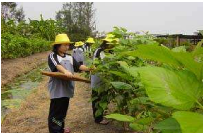
ภาพประกอบ 10 การฝึกเก็บสมุนไพร