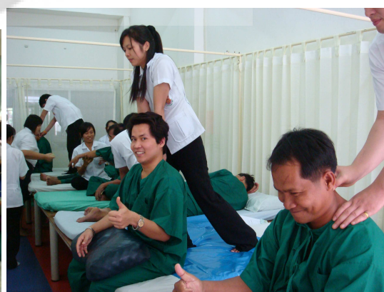
ภาพประกอบ 23 การฝึกนวดกับผู้ป่วยจริงจากการจัดกิจกรรมอาสาสถานนอกสถานที่